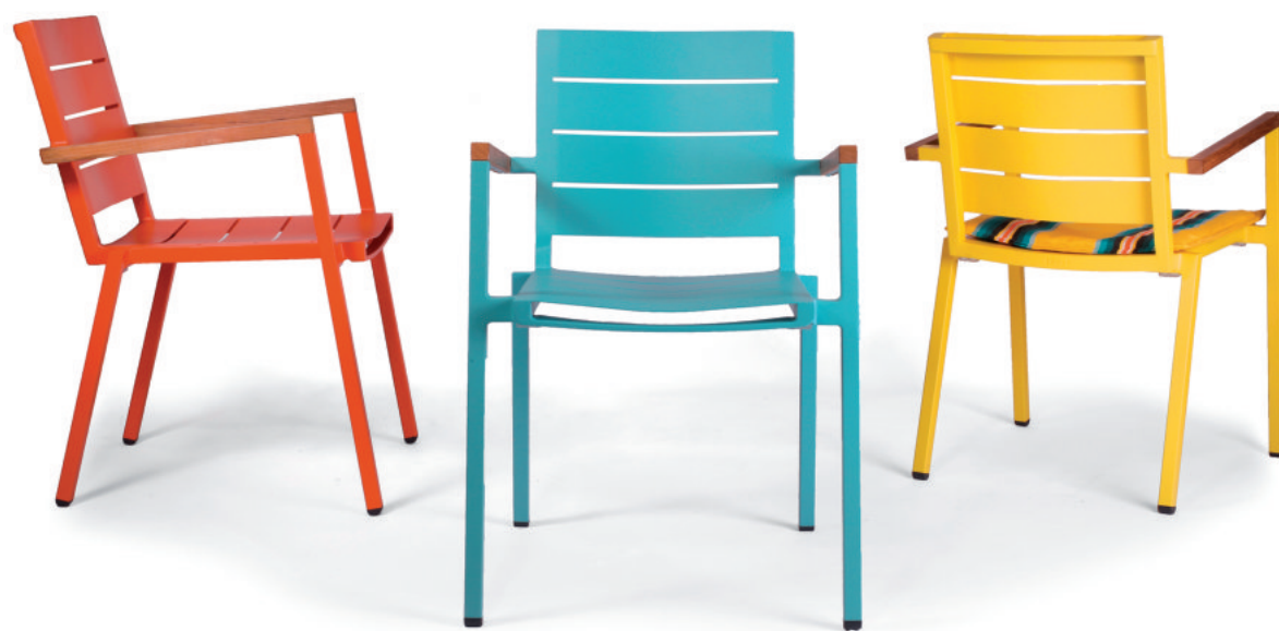
Bunter Dreier: Die neue Modellreihe 25.25 von May bietet stapelbare und wetterfeste Sessel in zahlreichen Farben