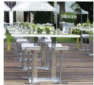
Der neue Designerhocker „LEM“ mit dem Designtisch „Ibiza“

Seit je her ist die Verwendung von Spitzenqualitäten das Markenzeichen der Party Rent Group. Deshalb hat Joris Bomers bei der neuen Range keine Kosten gescheut und neben den Häberli-Produkten ein weiteres Highlight aus dem lapalma-Programm aufgeboden. Der „Monza“ überzeugt durch seine schlichte Eleganz, was auf die sparsam eingesetzten aber hochwertigen Materialien zurückzuführen ist.