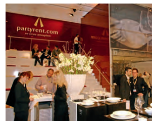
Der neue Messestand der Party Rent Group