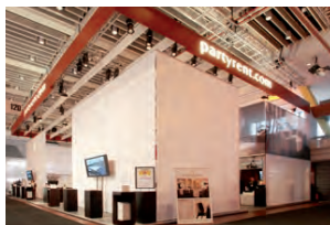
So präsentierte sich die Party Rent Group auf der WoE 2009

Das war eigentlich schon alles. Der Verbraucher muss sich kaum umstellen. Fast alles, was er oder sie in den letzten elf Jahren gelernt hat, wird auch in Zukunft Gültigkeit haben. Die WoE, pardon, die BoE ist und bleibt der Branchentreffpunkt Nr. 1 für das gesamte Eventbusiness.