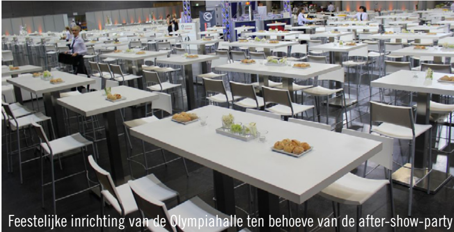
Feestelijke inrichting van de Olympiahalle ten behoeve van de after-show-party

Naar aanleiding van de wereldtitelstrijd boksen voor de zwaargewichten Vitali Klitschko en Dereck Chisora werden twee Party Rent vrachtwagens richting de Olympiahalle München gestuurd. Na onsportief gedrag en enkele schermutselingen buiten de ring, volgde op 18 februari het echte gevecht. Bij de zender RTL, en sinds 2006 exclusieve televisiepartner van de Klitschko-broers, begon het jaar 2012 met de 16e titelstrijd van WBC-champion Vitali Klitschko tegen Dereck Chisora en uiteindelijk zegevierde Vitali, ook wel genoemd 'Mr. Steelhammer'. Voor de aansluitende after-show-party in de aangrenzende "Olympiahalle" had het Klitschko-