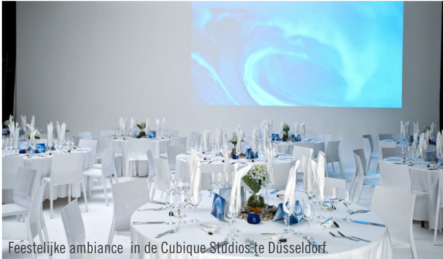
Feestelijke ambiance in de Cubique Studios te Düsseldorf.

In het kader van de presentatie van een nieuw parfum nodigde een klant van noi! Event & Catering circa 120 gasten uit in de Cubique Studios te Düsseldorf. Het event was een spannende uitdaging – zowel voor het noi!-team als ook voor Party Rent. Belangrijk bij de creatie van de gerechten was, om de in het parfum gebruikte basisingrediënten ook in het menu te laten terugkeren. De locatie werd volledig in wit gehuld en derhalve droeg deze ambiance bij aan het welslagen van het thema van dit event. Zo werd het nieuwe parfum – verpakt in een kenmerkende blauwe