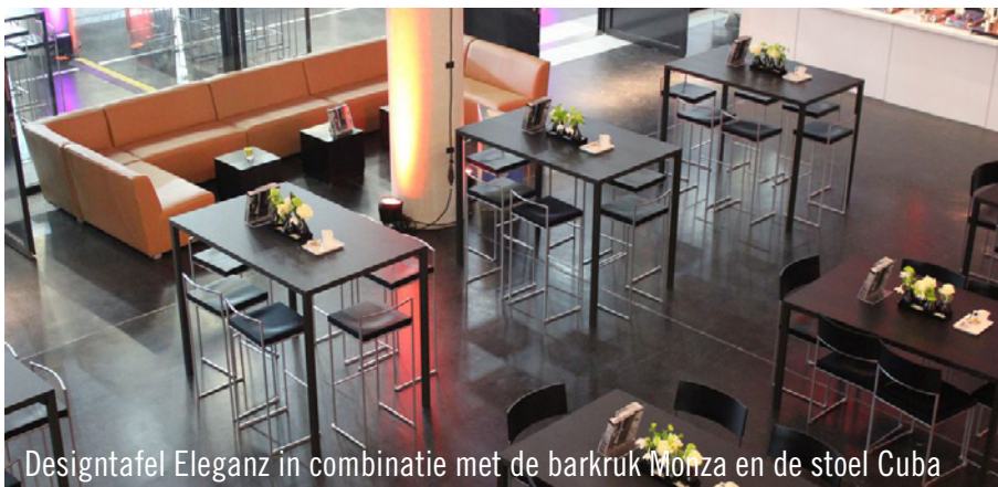
Design tafel Eleganz in combinatie met de barkruk Monza en de stoel Cuba