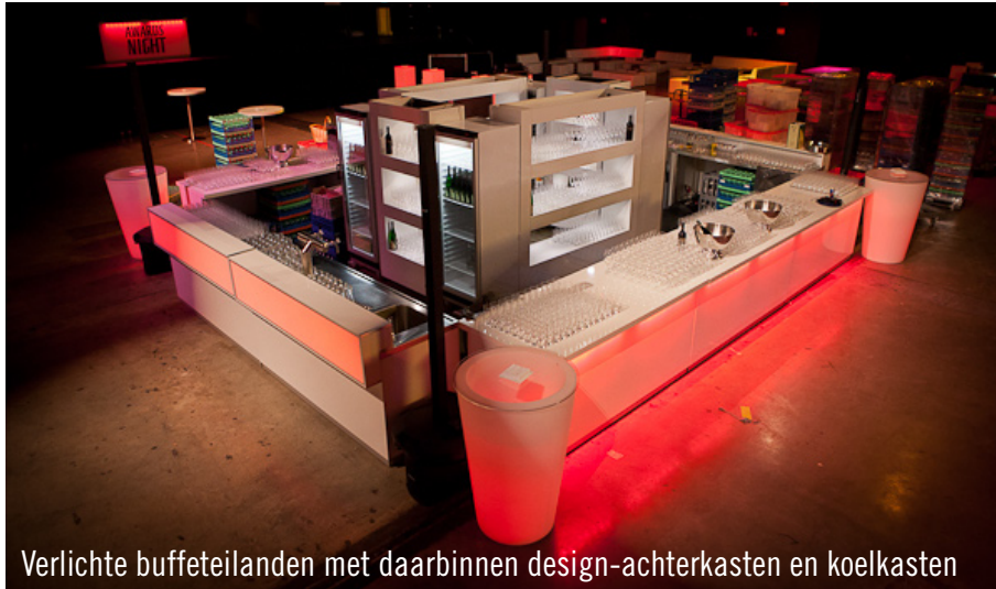
Verlichte buffeteilanden met daarin design-achterkasten en koelkasten

Op 15 februari 2012 vond in de Luxemburgse Rockhal de "Awardnight" plaats – een prijsuitreiking waar de beste reclamecampagnes van Luxemburgse communicatiebureaus worden onderscheiden. Op deze avond werden twee verschillende prijzen uitgereikt: de "Grand Prix de la Communication" door het blad Paperjam en de "Media Award 2012" door RTL Luxemburg. Onze Luxemburgse vestiging uit Echternach was de eventpartner voor deze avond en leverde het meubilair. Maar liefst 60 meter buffet met led-verlichting, deels