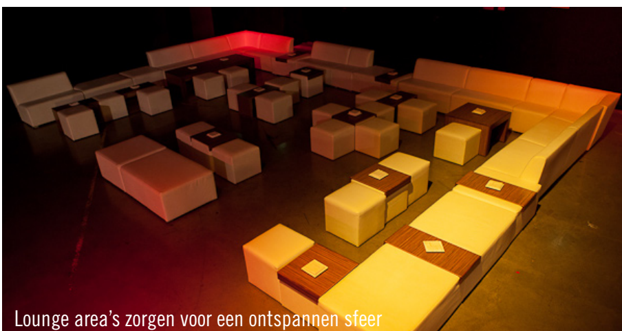
Lounge area's zorgen voor een ontspannen sfeer

tot gesloten buffeteilanden gevormd – met binnenin design-achterkasten en koelkasten –, vulden de hal. Voor een communicatieve sfeer zorgden de statafels Ibiza met de barkrukken Monza waarop de gasten plaats konden nemen. Een groot zitcomfort verschaften bovendien de gezellig ingerichte lounge area's, die de gasten tot een lekker lang en ontspannen verblijf uitnodigden. Opnieuw een geslaagd evenement met gelukkige prijswinnaars, tevreden organisatoren en ook de gasten waren diep onder de indruk.