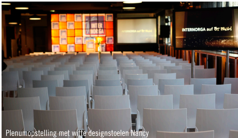
Plenumopstelling met witte designstoelen Nancy