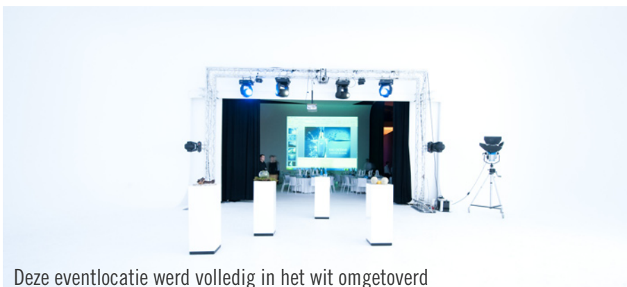
Deze eventlocatie werd volledig in het wit omgetoverd

flacon – bijzonder expressief gepresenteerd. Een voor alle gasten buitengewone ervaring was het verblijf in de, eveneens volledig in het wit ingerichte, Foto-Hohlkehle. In deze zaal is het voor het oog, door de schijnbaar ontbrekende horizon, niet meer herkenbaar waar de ruimte begint en waar deze ophoudt. Na het menu werd – passend bij het gepresenteerde parfum – het blauwetrendydrankje 'Hyp' uit de VS geserveerd. Tot drie uur in de ochtend werd er gefeest en gedanst op uitstekende muziek en met coole cocktails.