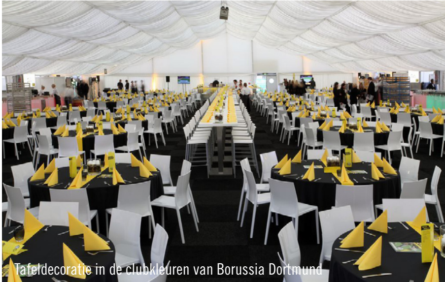
Tafeldecoratie in de clubkleuren van Borussia Dortmund

Borussia Dortmund en Schalke 04 ontmoetten elkaar tijdens de streekderby in het uitverkochte Signal-Iduna-Park in Dortmund. De kampioen van de Duitse voetbalcompetitie BVB Dortmund kreeg vooraf meer dan 1.000 aanvragen voor extra tickets in de VIP-loges. Om aan alle aanvragen te kunnen voldoen, werd voor het stadion van Dortmund een VIP-tent gebouwd. De tent werd ingericht met designmeubelen van Party Rent: