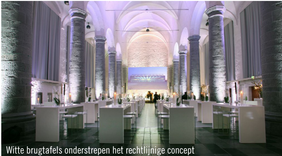
Witte brugtafels ondersteunen het rechtlijnige concept

Wie voor zijn evenement een bijzondere locatie in Aken zoekt, is bij het Stedelijke Cultuurbedrijf precies aan het juiste adres. Het cultuurbedrijf biedt verschillende bijzondere ruimtes, waaronder de voormalige kloosterkerk en de aula Carolina van het Kaiser-Karls-Gynasium. Het internationale architectenbureau, GMP Generalplanungsgesellschaft mbH koos ervoor om de festiviteiten rond het 25-jarige bestaan van hun filiaal in Aken op deze monumentale locatie te laten plaatsvinden. Om de aula om te toveren in een evenementen-