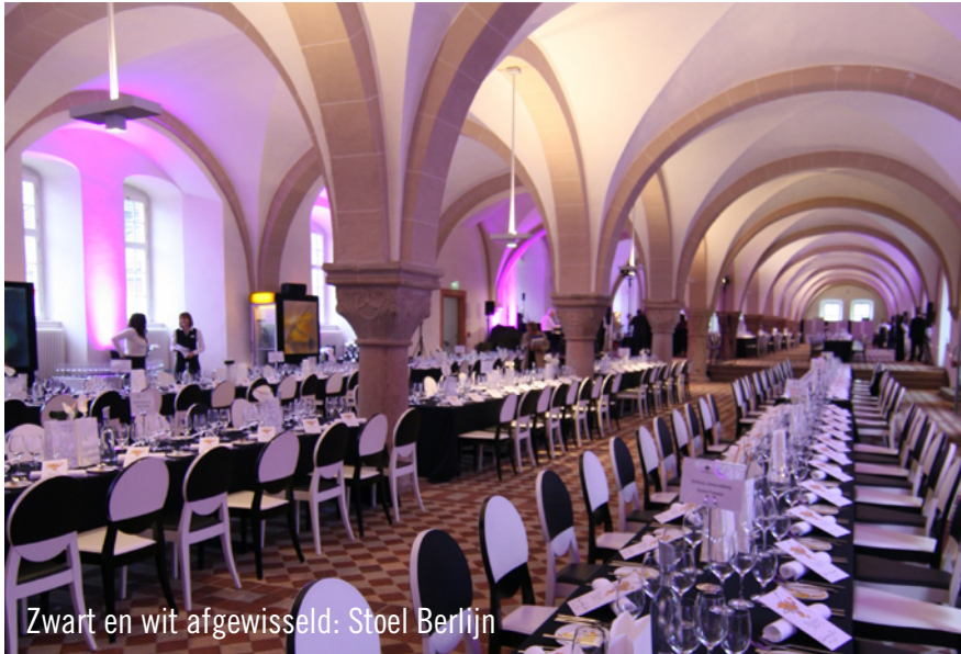
Zwart en wit afgewisseld: Stoel Berlijn

Traditiegetrouw behoort het Riesling-gala tot één van de meest vooraanstaande evenementen in Duitsland. Zowel op culinair als op maatschappelijk gebied vormt dit event het jaarlijks het hoogtepunt van de Glorieuze Rheingau Dagen. Ook dit jaar was de organisatie in handen van de VDP-Rheingau. Zo bijzonder dit evenement is, zo uniek was ook de locatie van het evenement – het Iekendor-mitorium in het klooster Eberbach in Eltvile.