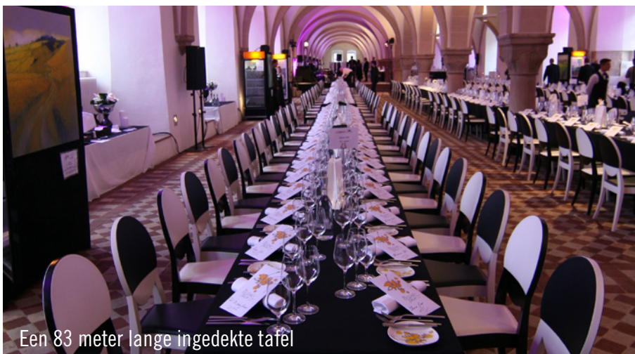
Een 83 meter lange ingedekte tafel

In de met kruisgewelven uitgeruste zaal werd een 83 meter lange tafel feestelijk ingedekt. De hiervoor gebruikte Table Top werd geleverd door Party Rent Frankfurt. Als Partner van dit unieke evenement zorgde dit team bovendien voor al het meubilair alsmede de keuken-uitrusting. Gasten van over de hele wereld namen plaats aan de grote tafel in het Iekendormitorium van het klooster en genoten van een heerlijk avond.