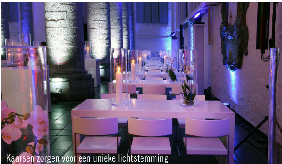
Kaarsen zorgen voor een unieke lichtstemming

locatie, werd het team van Party Rent Düsseldorf/Keulen ingeschakeld. De grootste uitdaging lag in de ietwat moeilijke aflevering van het materiaal. Door de situatie in de binnenstad van Aken kon het meubiliair alleen met kleinere voertuigen worden aangeleverd. Verder werd er bij de keuze van het meubilair goed gekeken naar de kleur en de vorm van de kerk. Zo werden in deze ruimte de brugtafels in verschillende hoogtes met de populaire designbarkrukken Monza en de passende stoelen Cuba gecombineerd.