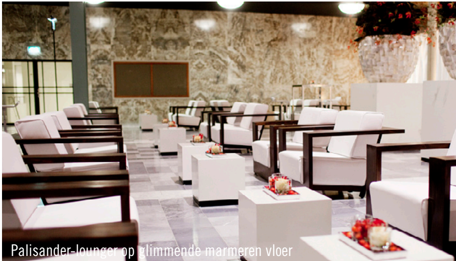
Palisander-lounger op glimmende marmeren vloer

Op 22 november vond voor de 11de keer het „Life Sciences Momentum“ in het World Trade Center in Rotterdam plaats. Ruim 600 gasten waren aanwezig bij dit event in het centrum van de stad. In opdracht van organisatiebureau Publi-market B.V. werkte Party Rent Arnhem het totaalconcept uit. Zowel het meubilair als de decoratiestukken moesten via een lift naar de afzonderlijke ruimtes worden aangeleverd en ook de totale opbouw werd Party Rent toevertrouwd. Dankzij de daadkrachtige