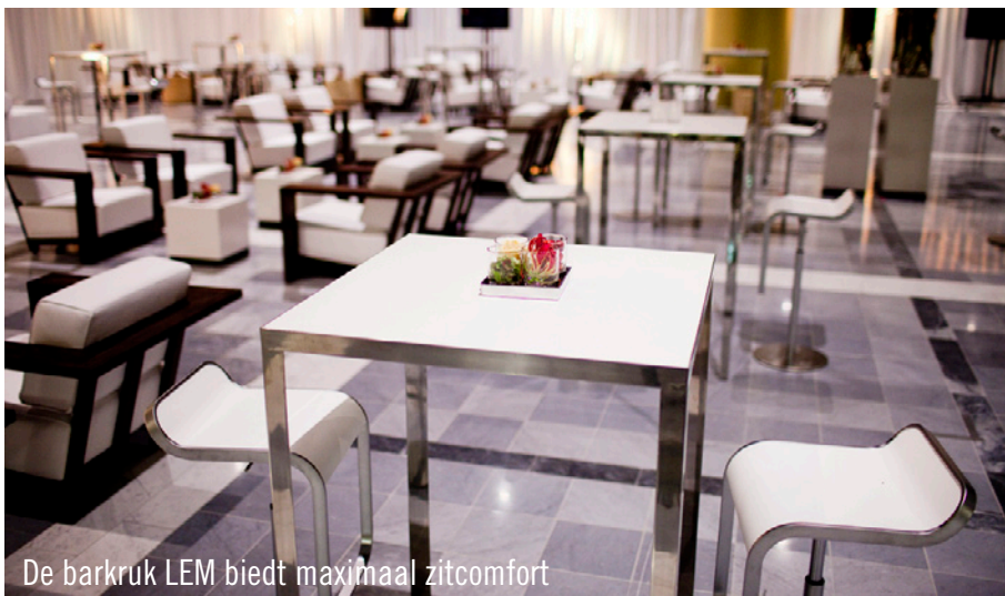
De barkruk LEM biedt maximaal zitcomfort

ondersteuning van 10 medewerkers van Party Rent vormde deze uitdaging geen enkel probleem. Het „WTC“ bleek een perfecte locatie voor dit prominente event te zijn. Op de marmeren vloer schitterden niet alleen de nieuwe Zinzo- en Palisander meubelen maar ook het moderne Party Rent meubilair, overwegend in bruin en wit, bood de genodigden de hele avond perfect zitcomfort. In deze gezellige ambiance was er voldoende gespreksstof om ervaringen uit te wisselen.