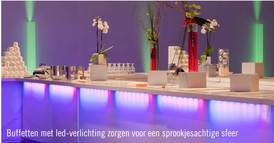
Buffetten met led-verlichting zorgen voor een sprookjesachtige sfeer

Wist u eigenlijk al dat de vestiging van Party Rent Parijs slechts 1,5 km van Euro-Disneyland af ligt? Derhalve hadden de drie vrachtwagens, met een laadvolume van in totaal 150 m 3 , niet veel tijd nodig om het event-equipment, besteld door het beroemde Parijse organisatiebureau 'Communication Media Partner', bij het in Disneyland liggende Hotel New York af te leveren. De supermarktketen Carrefour vierde in dit meest gerenommeerde hotel van Disneyland met ca. 750 gasten een groots evenement. CMP-projectleider Anouschka Thevenet en haar team waren enthousiast over