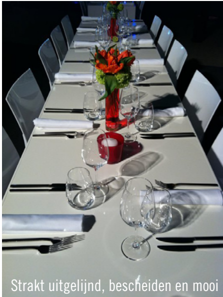
Strakt uitgelijnd, bescheiden en mooi

Bij de opbouw van een evenement voor een automobiël-concern moest Party Rent Stuttgart even flink gas geven. De opdracht was een enorme uitdaging: