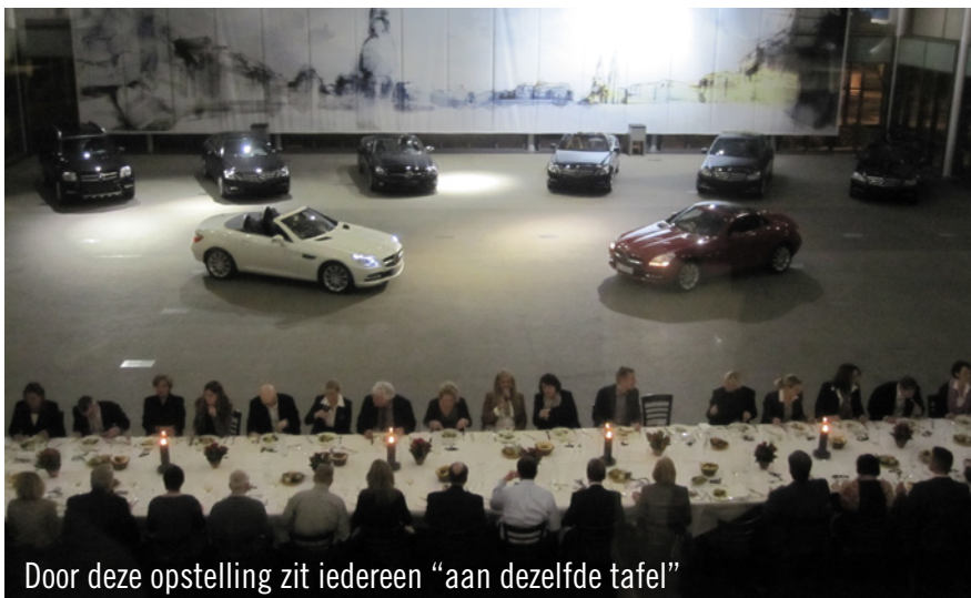
Door deze opstelling zit iedereen "aan dezelfde tafel"

Wij verheugen ons op talrijke nieuwe evenementen op deze exclusieve event-locatie.