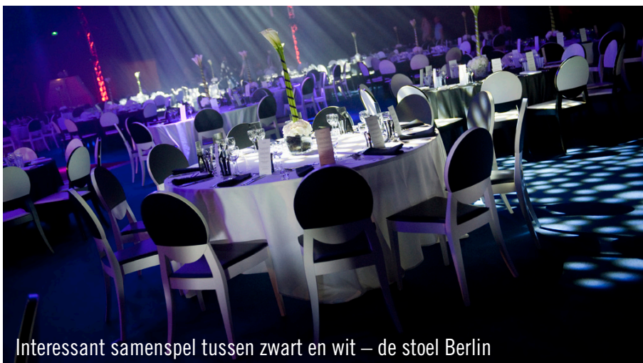
Interessant samenspel tussen zwart en wit – de stoel Berlin

Alle leden van het Parijse Party Rent team bedanken hierbij nogmaals CMP voor het in hen gestelde vertrouwen en de perfecte samenwerking.