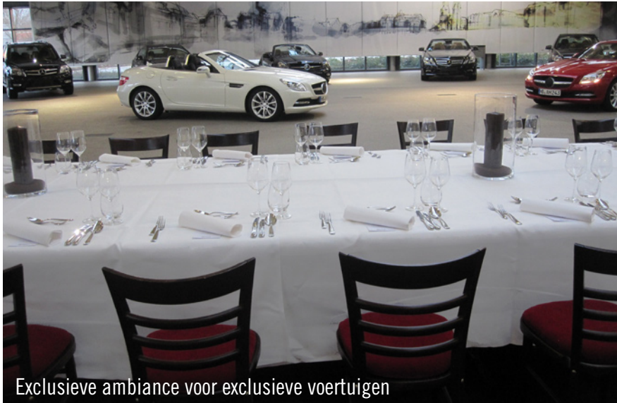
Exclusieve ambiance voor exclusieve voertuigen

Voor een select publiek werd in het Mercedes-Benz-Customer-Center, nog voor de officiële marktintroductie, de nieuwe SLK onthuld. Voor deze unieke gelegenheid was ook Party Rent Bremen uitgenodigd. Dit team leverde allerlei equipment aan Mercedes-Benz. Een lange stijlvolle ingedekte tafel op een betoverend rood tapijt vormden op deze avond de ambiance voor de exclusieve 'sneak preview'.