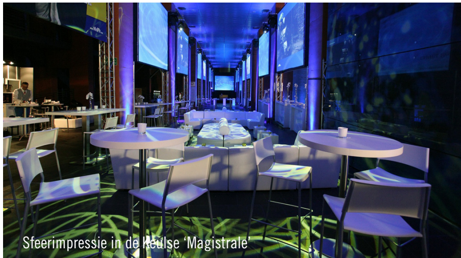
Sfeerimpressie in de Keulse 'Magistrale'

Op 19 maart 2011 stond bokser Vitali Klitschko als wereldkampioen zwaargewicht opnieuw in de ring. In de LANXESS-Arena in Keulen verdedigde hij zijn titel tegen zijn uitdager Odlanier Solis. Na drie minuten was de strijd reeds gestreden. Het feest dat volgde, duurde gelukkig wel wat langer.