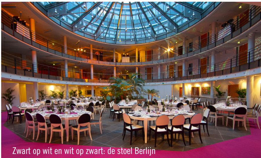
Zwart op wit en wit op zwart: de stoel Berlijn

Ook in het achtste jaar was de organisatie van dit evenement, alsmede natuurlijk de 300 gasten, uiterst tevreden en verheugen zij zich nu al op de samenwerking in 2012.