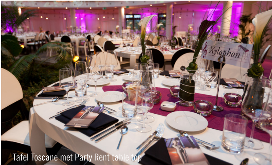
Tafel Toscane met Party Rent table top

... haar jaarlijkse algemene vergadering houdt, moet alles tot in de puntjes verzorgd zijn. Niet voor niets geniet Party Rent Luxemburg al sinds 2004 het volste vertrouwen van de organisatoren voor dit evenement.