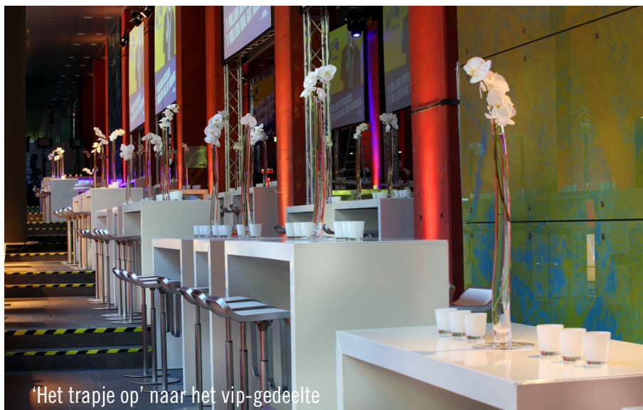
'Het trapje op' naar het vip-gedeelte

Vitali Klitschko en zijn broer Wladimir zijn beide wereldtop in de ring – en Party Rent blijft aan top als het gaat om het verzorgen van event-equipment.