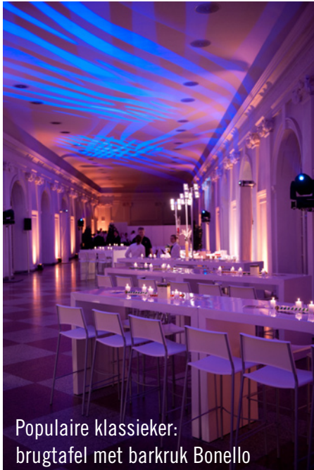
Populaire klassieker: brugtafel met barkruk Bonello

December 2010 vierden Angelina Jolie en Johnny Depp de Europese première van hun film 'The Tourist' in Berlijn. Ook regisseur en Oscar-winnaar Florian Henckel von Donnersmarck betrad op de Potsdamer Platz de rode loper.