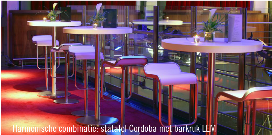
Harmonische combinatie: statafel Cordoba met barkruk LEM

Het Colosseum Theater Essen was vroeger vooral bekend vanwege zijn groots geësceneerde musicals. Tegenwoordig wordt het vooral gebruikt als eventlocatie. De afdeling evenementen van het Colosseum Theater vierde in maart van dit jaar al weer haar 10-jarige jubileum - een tijd waarin zij tal van gerenommeerde klanten uit de eventbranche ten volle heeft kunnen overtuigen met zowel de locatie als de 'Full Service'. In een boeiende industriecoullisse kan het Colosseum Theater Essen de passende ambiance bieden voor elk event dat een groots evenement moet worden.