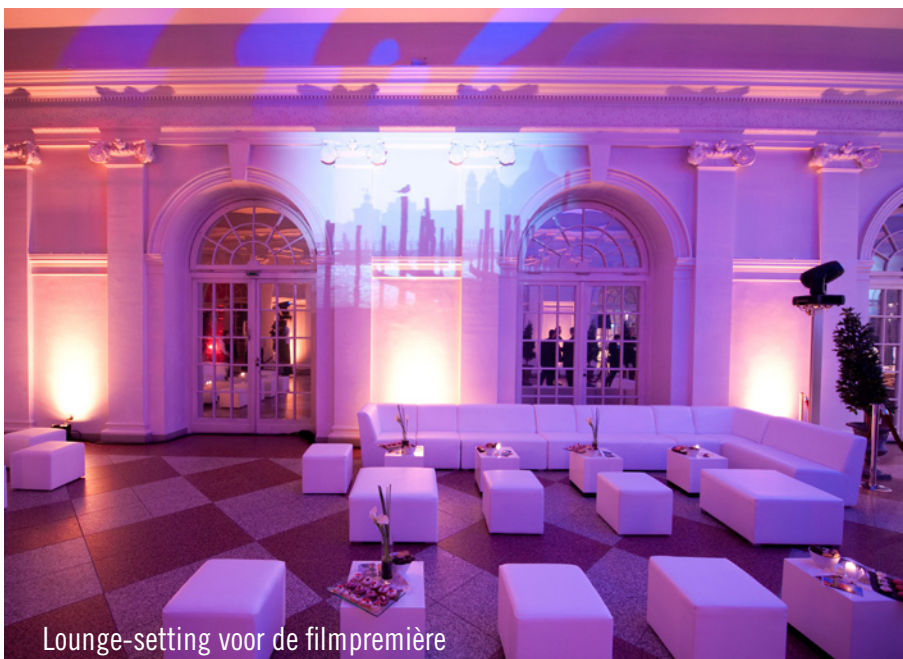
Lounge-setting voor de filmpremière

Voor de filmpremière in het Sony Center leverde Party Rent naast enkele tenten ook allerhande meubilair. De inrichting van de 'After-Show-Party', die na de première werd gehouden in de Orangierie, werd ook verzorgd door Party Rent Berlijn. Het eventbureau "Wilde Beissel von Schmidt GmbH" koos voor de populaire brugtafels gecombineerd met de witte Bonello-barkrukken uit het Party Rent-assortiment. De lounge-setting werd eveneens vormgegeven door het witte Party Rent "Hollywood-meubilair" en bood zowel de Hollywood-sterren als de vele genodigden een comfortabele zitplek voor een gezellig gesprek. Na de filmpremière en de daarop volgende After-Show-Party kreeg de film een oorverdovend applaus. Ook het team van de Berlijnse Party Rent-vestiging oogstte vele lofuitingen.