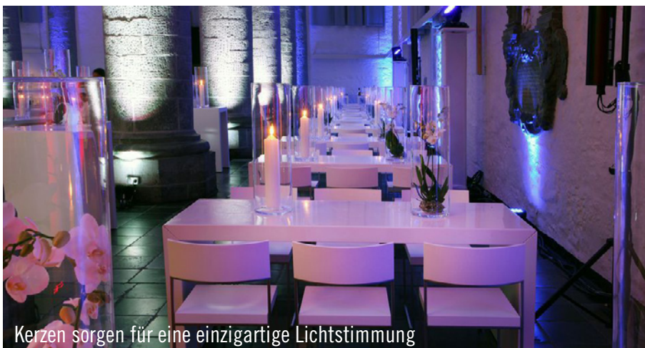
Kerzen sorgen für eine einzigartige Lichtstimmung

das Team von Party Rent Düsseldorf/Köln beauftragt. Die Herausforderung lag in der erschwerten Materialanlieferung, die aufgrund der Innenstadtlage nur mit einem Koffervan und einem Sprinter möglich war. Zudem standen bei der Wahl des Mobiliars die Gradlinigkeit im Fokus sowie ein Aufbau, der die Sichtachsen der Kirche unterstützt. So wurden in der ehemaligen Kirche die Brückentische als Steh- und Bankettisch mit den beliebten Designbarhockern Monza sowie den passenden Stühlen Cuba kombiniert.