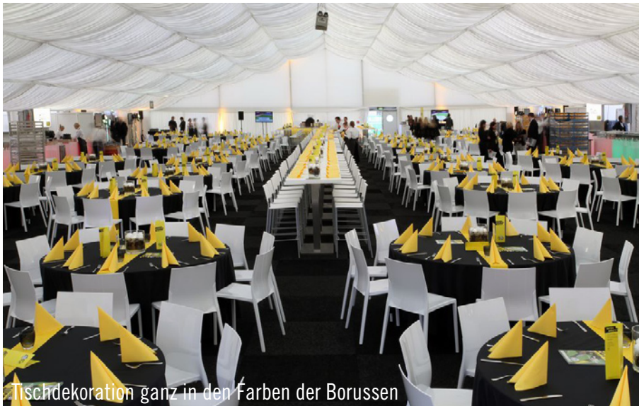
Tischdekoration ganz in den Farben der Borussen

Borussia-Dortmund und Schalke 04 trafen beim Revier-Derby im ausverkauften Signal-Iduna-Park aufeinander. Der Meister bekam im Vorfeld über 1.000 Anfragen für zusätzliche Karten in den VIP-Logen. Damit allen Anfragen gerecht werden konnte, wurde für das Derby vor dem Dortmunder Stadion ein Zelt errichtet. Bestückt wurde dieses mit Designermöbeln von Party Rent: 40 runde Tische mit weißen Stühlen Nancy