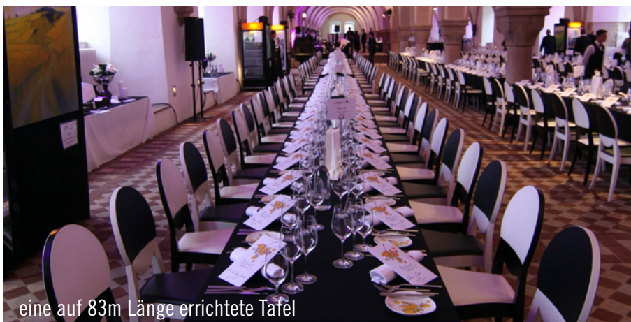
eine auf 83m Länge errichtete Tafel

itorium im Kloster Eberbach in Eltville. In einem mit Kreuzgratgewölben versehenen Raum wurde eine auf 83m Länge errichtete Tafel feierlich eingedeckt. Das hierfür eingesetzte Table Top lieferte Party Rent Frankfurt. Als Partner dieses einzigartigen Events stellte das Party Rent Team zudem das gesamte Mobiliar sowie das Küchenequipment zur Verfügung. Gäste aus aller Welt versammelten sich an der großen Tafel im Laiendormitorium des Klosters und feierten gemeinsam den Riesling.