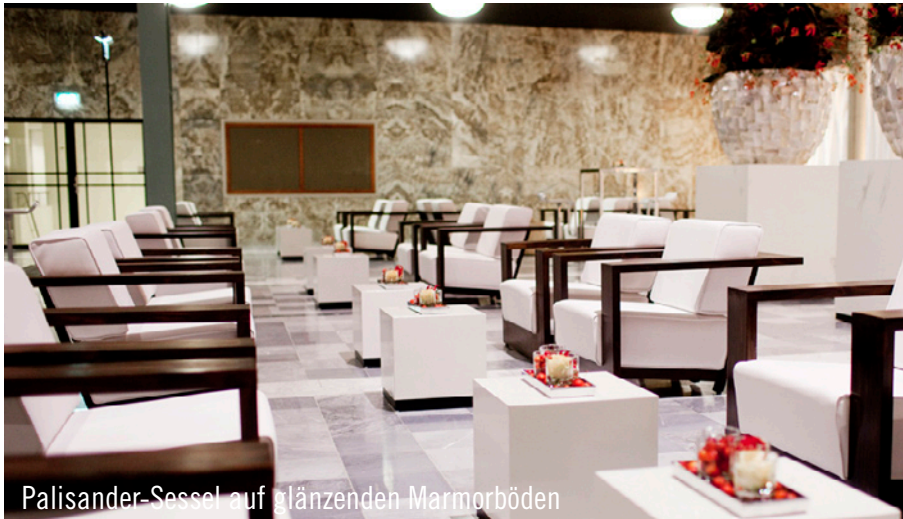
Palisander-Sessel auf glänzenden Marmorböden

Am 22. November fand zum 11. Mal das „Life Sciences Momentum“ im World Trade Center in Rotterdam statt. 600 Gäste waren zum Event im Zentrum der Stadt geladen. Beauftragt von der Agentur Publimarket B.V. erstellte Party Rent Arnheim das Gesamtkonzept, das von ersten Zeichnungen, über Mobiliarvorschläge bis hin zur Dekoration reichte. Das gesamte Event Equipment musste mit einem Aufzug in die Eventräume geliefert und anschließend aufgebaut werden. Mit tatkräftiger Unterstützung