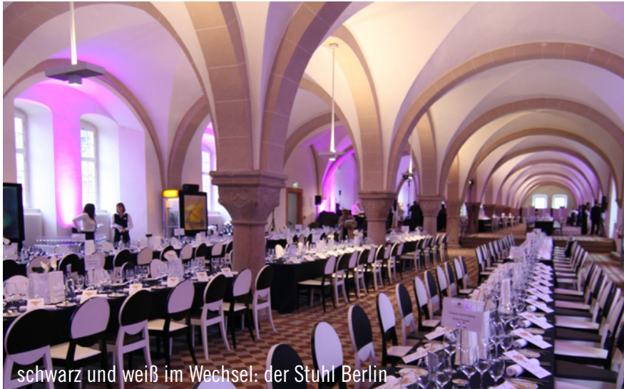
schwarz und weiß im Wechsel: der Stuhl Berlin