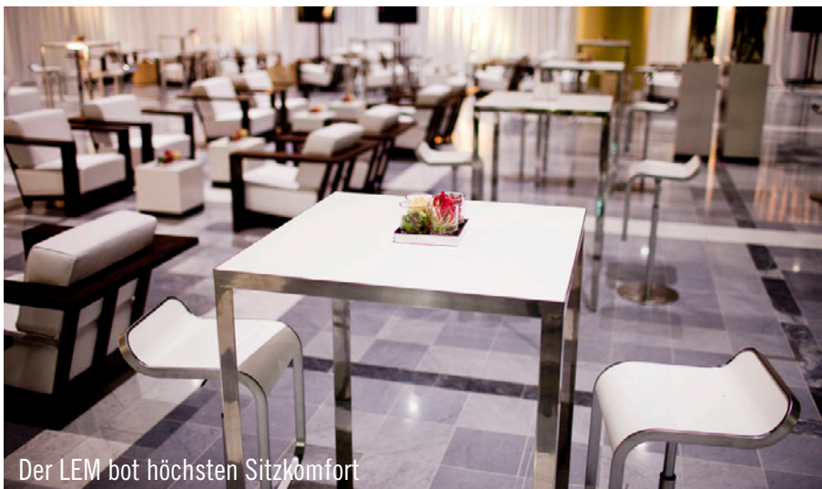
Der LEM bot höchsten Sitzkomfort

eines 10-köpfigen Party Rent Teams konnte diese Hürde mit Bravour genommen werden. Das „WTC“ erwies sich als perfekte Kulisse für diesen hochkarätigen Event. Auf Marmorböden glänzten nicht nur die neu ins Party Rent Programm aufgenommenen Zinzo- und Palisander Möbel. Auch weiteres Mobiliar, vorwiegend in Braun und Weiß, bot den Geladenen Sitzkomfort während des gesamten Abends. In gemütlicher Atmosphäre konnte genügend Gesprächsstoff ausgetauscht werden.