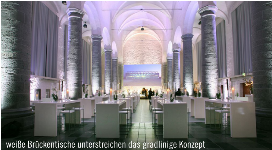
weiße Brückentische unterstreichen das gradlinige Konzept

Wer für seine Veranstaltung eine besondere Location in Aachen sucht, für den ist der städtische Kulturbetrieb genau der richtige Ansprechpartner. Dieser vermietet repräsentative Räumlichkeiten, zu denen auch die ehemalige Klosterkirche und jetzige Aula Carolina des Kaiser-Karls-Gymnasiums gehört. So entschied sich das internationale Architekturbüro, die GMP Generalplanungsgesellschaft mbH, die Feier zum 25-jährigen Bestehen der Niederlassung Aachen in der denkmalgeschützten Location auszutragen. Für die Verwandlung der Schulaula in eine Eventlocation wurde