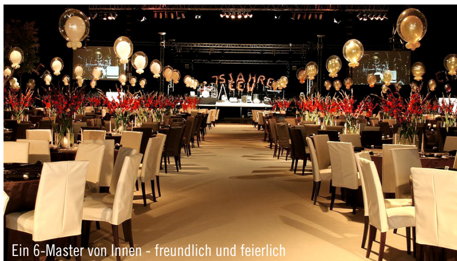
Ein 6-Master von Innen – freundlich und feierlich

Im Rahmen einer 3-Tages-Veranstaltung entschied sich die Erndtebrücker Eisenwerk GmbH & Co KG dazu, ihren 75sten Geburtstag auf dem eigenen Betriebsgelände zu feiern. So waren ein Kundentag, ein Vertretertag sowie ein Tag der offenen Tür geplant.