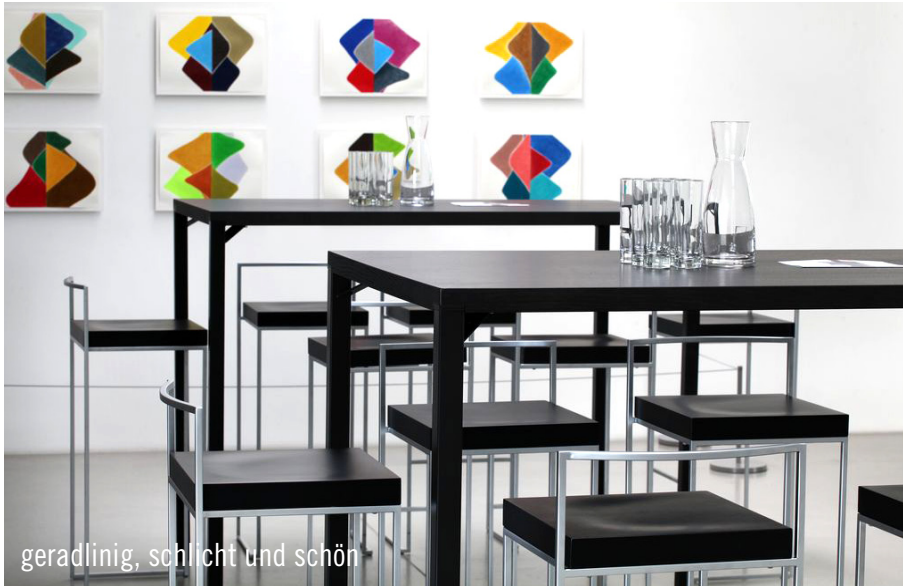
geradlinig, schlicht und schön

Nicht nur für Ausstellungen ist das Kunst- und Ausstellerhaus der Langen Foundation in Neuss, errichtet vom japanischen Architekten Tadao Ando, eine erstklassige Adresse. Auch für Veranstaltungen bietet sie ein exklusives Umfeld und entwickelt Flair, wie er nur selten erreicht wird. Auch zum Sammlerfest anlässlich des Galerien-Wochenendes DC Open war die Langen Foundation auf der Raketenstation Hombroich Gastgeberin. 700 Gäste aus der internationalen Kunstszene waren geladen.