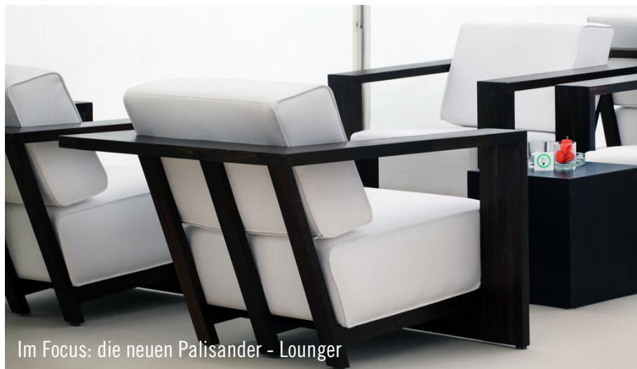
Im Focus: die neuen Palisander - Lounger

Eine Kundenanfrage über eine Komplett-ausstattung für 200 Personen kommt bei der Party Rent Group nicht selten vor. Aber dass eine solche Anfrage erst zehn Werktage vor Veranstaltungsbeginn eingeht, inclusive Konzepterarbeitung, erlebt man nicht alltäglich.