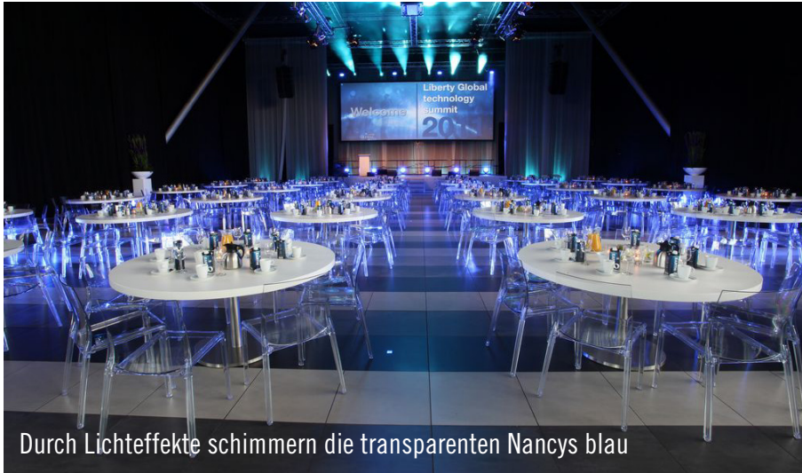
Durch Lichteffekte schimmern die transparenten Nancys blau

Das PTA (Passenger Terminal Amsterdam) ist eine beliebte Eventlocation. Das imposante Gebäude ist weitgehend aus Glas und in Form einer großen Welle konstruiert. Die große Empfangshalle, in der Kreuzfahrtpassagiere ankommen und abfahren, bietet eine schöne Aussicht auf die Stadt. Aufgrund seiner flexiblen Konstruktion kann der Saal auch für Konferenzen und Events genutzt werden.