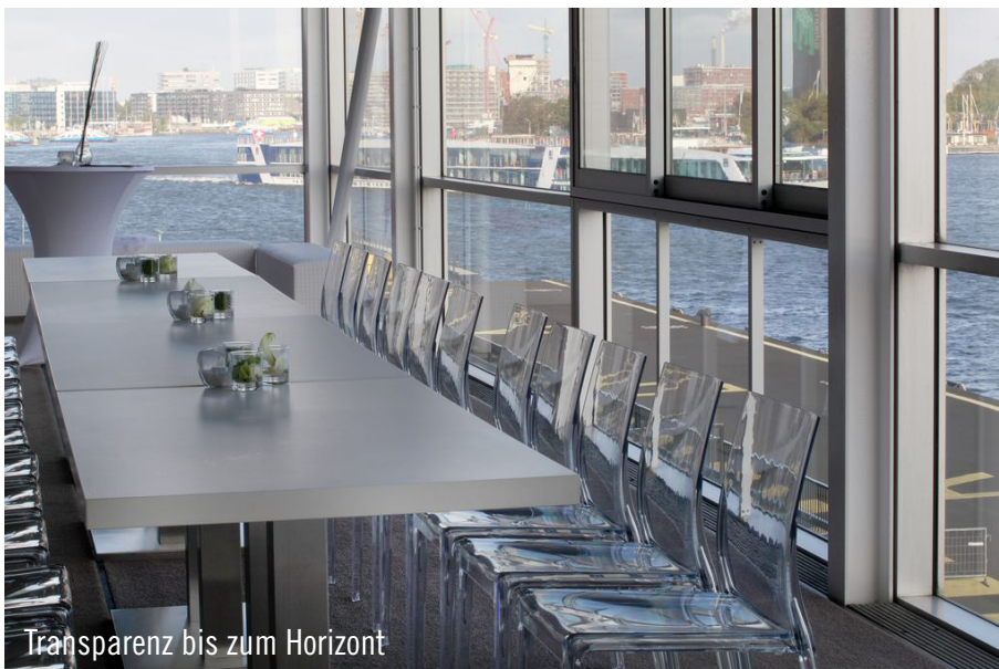
Transparenz bis zum Horizont

So wurde das Team von Party Rent Arnheim von der Agentur Luidkeels beauftragt, eine Veranstaltung mit 750 Gästen dort auszustatten. Passend zur gläsernen Fassade des Gebäudes entschied sich das Projektteam für runde Ibiza-Tische mit transparenten Nancy-Stühlen. Mit verschiedenen Lichteffekten reflektierten die Stühle unterschiedliche Farben und zauberten damit eine faszinierende Stimmung.