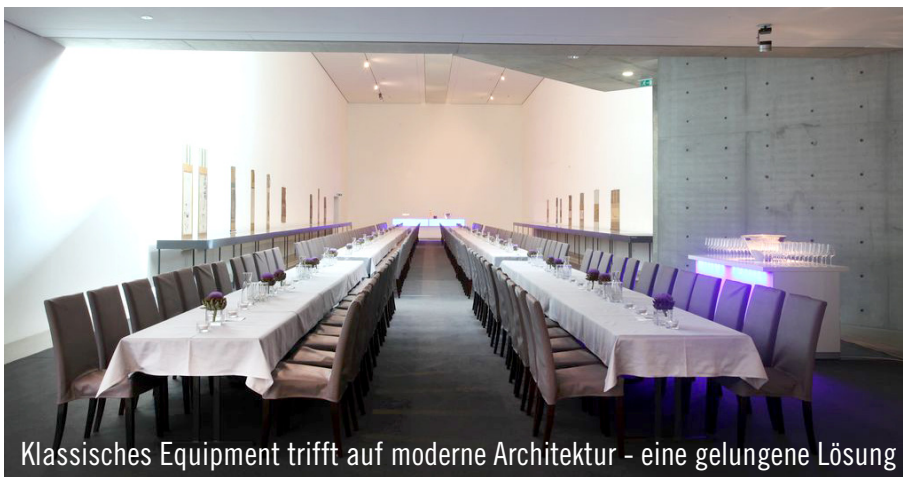
Klassisches Equipment trifft auf moderne Architektur - eine gelungene Lösung

Innerhalb einer Nacht und einem Tag verwandelte sich die Kunsthalle in eine feierliche Eventlocation, ohne den puristischen Charme einer Kunstausstellung zu verlieren. Lemonpie traf dabei die Auswahl des Mobiliars. Das Ergebnis erfreute nicht nur die Aufbaucrew. Auch der verantwortliche Event-Caterer Lemonpie war beeindruckt. Laut den Kommentaren der 700 Gäste, war es eines der schönsten Feste, das die Kunstwelt im Rheinland seit langem erlebt hatte.