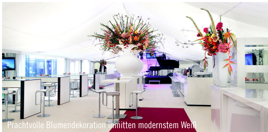
Prachtvolle Blumendekoration inmitten modernstem Weiß

Vom ersten Kundenkontakt mit Party Rent hat es lediglich sieben Werktage gedauert, bis die ersten Aufbauarbeiten losgingen – und das mitten in der Hauptsaison. Die Leasing Union hat sich zu 100% auf Party Rent verlassen. Und es hat sich gelohnt: Die Palisander-Möbel, die erst einen Tag vor Auslieferung fertig gestellt wurden sowie die von Party Rent zusammengestellte Dekoration fanden großen Anklang bei den 200 geladenen Gästen.