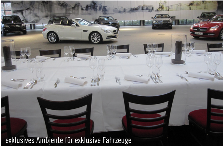
exklusives Ambiente für exklusive Fahrzeuge

Vor einem ausgewählten Publikum wurde im Mercedes-Benz Kundencenter noch vor der offiziellen Markteinführung der neue SLK enthüllt. Bei diesem einzigartigen Ereignis durfte auch Party Rent Bremen dabei sein. Für Mercedes-Benz lieferte unser Team zahlreiches Equipment. Eine lange Tafel auf einem glamourösen roten Teppich und edles Table Top bildeten an diesem Abend das Ambiente für die exklusive Vorabpremiere.