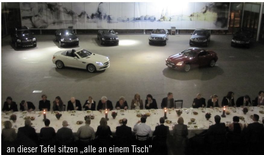
an dieser Tafel sitzen „alle an einem Tisch“

Auch die Chefin selbst war vor Ort und sichtlich angetan von dem gelungenen Abend. Wir freuen uns auf zahlreiche weitere Veranstaltungen in dieser exklusiven Veranstaltungslage.