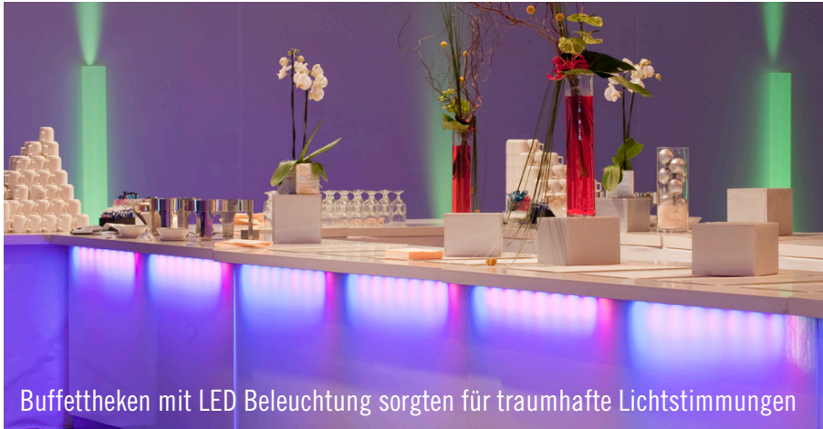
Buffettheken mit LED Beleuchtung sorgten für traumhafte Lichtstimmungen