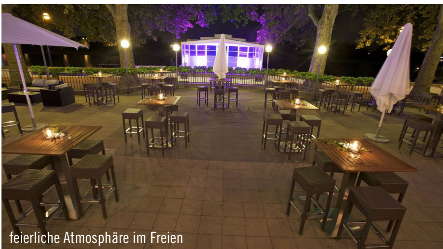
feierliche Atmosphäre im Freien