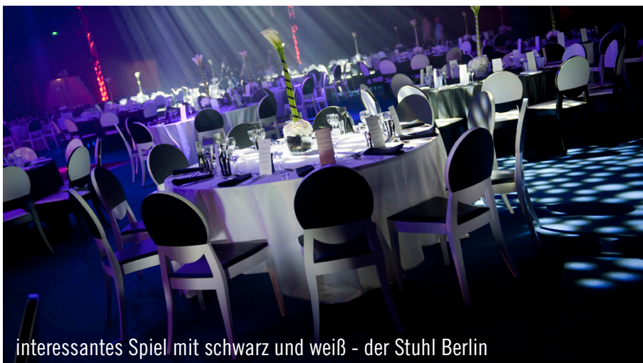
interessantes Spiel mit schwarz und weiß - der Stuhl Berlin

Lösungen seitens Party Rent und fasste abschließend zusammen: „Es war uns eine Freude, einen Event zu entwickeln, in dem für den Pariser Markt eher untypische Möblierung zum Einsatz kam. Dank der richtigen Partnerwahl war nicht nur unser Team zufrieden, auch die 650 geladenen Gäste waren beeindruckt und erlebten in gemütlicher Atmosphäre eine rundum gelungene Veranstaltung.“ Im gleichen Zuge bedankt sich das gesamte Pariser Party Rent Team bei der CMP für das entgegengebrachte Vertrauen und die einwandfreie Zusammenarbeit.