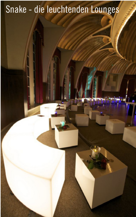
Snake - die leuchtenden Lounges

Beim großen Finale des Eurovision Song Contest in Düsseldorf vertrat erneut Lena mit dem Song „Taken By A Stranger“ unser Land. Es war eine beeindruckende Show mit überraschenden Gewinnern und einem guten zehnten Platz für Lena. Auf der großen After-Showparty in den Rheinterrassen feierte die ESC-Prominenz bis in die frühen Morgen-