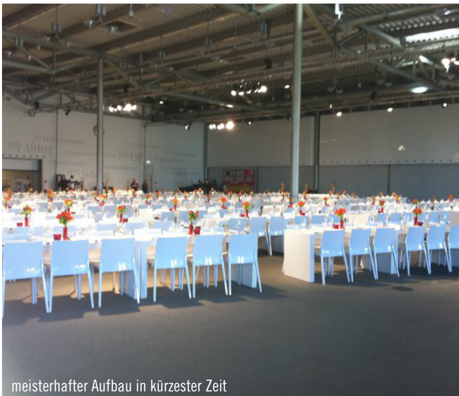
meisterhafter Aufbau in kürzester Zeit