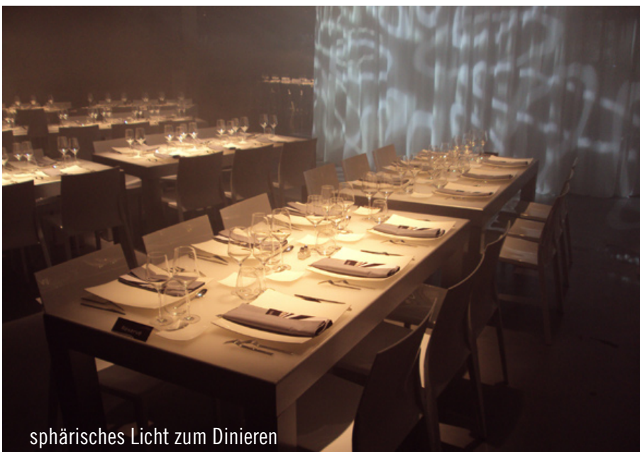
sphärisches Licht zum Dinieren

Rent Paris zwei Auflieger mit Event-Equipment in den Süden Frankreichs. 32 Leuchttische tauchten die Veranstaltung in ruhiges, sphärisches Licht - während es im Loungebereich knallig zuing. Auf rotem Teppich kontrastierte das weiße Loungemobiliar mit dunklen Holzelementen.