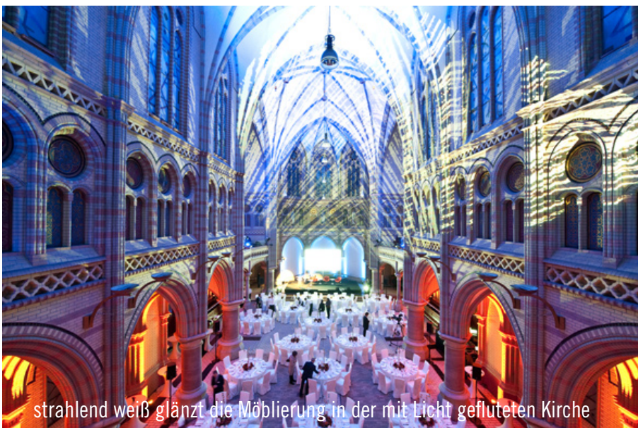
strahlend weiß glänzt die Möblierung in der mit Licht gefluteten Kirche

tung“. Zwei Gewinner - noi! als „Caterer des Jahres“ in der Kategorie „Newcomer & Aufsteiger des Jahres 2010“ und die Party Rent Group mit dem „Catering-Star“ in der Kategorie „Non-Food-Caterer“ - arbeiteten Hand in Hand. Party Rent Hamburg verantwortete die hochwertige Ausstattung der Kirche und 64 „noilinge“ verwöhnten 250 Gäste mit einem hochwertigen 3-Gang-Menü. Nicht zuletzt beeindruckte die Location mit der einzigartigen Ausleuchtung die Gäste. Es war eine rundum gelungene Veranstaltung.