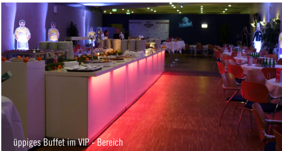
üppiges Buffet im VIP - Bereich

Es gibt viele beeindruckende Arenen, aber die Atmosphäre im „Fuchsbau“ ist eine ganz besondere. Party Rent Berlin sorgt für eine einzigartige Event-Atmosphäre, während das Hotel Berlin, Berlin für den kulinarischen Genuss verantwortlich ist. Variabler Einsatz von diverser Küchenequipment über Table-Top bis hin zu vielseitigem Mobiliar, ist erfolgsversprechend, auch für die Berliner Handballer.