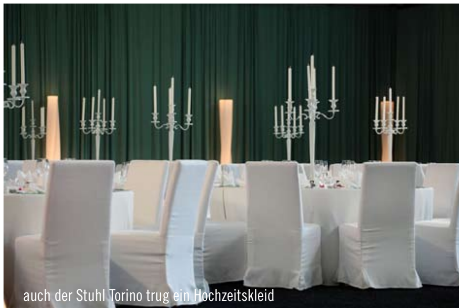
auch der Stuhl Torino trug ein Hochzeitskleid

Wenn man Tennisspielerin ist, Vater und Bruder Tennistrainer sind und die Tennishalle das zweite zu Hause ist, könnte man auch auf die Idee kommen, die eigene Hochzeit auf dem Tennisplatz zu feiern. In diesem Fall wurde sie in die Tat umgesetzt.