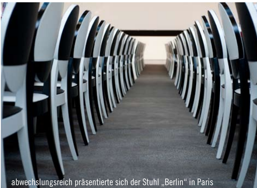
abwechslungsreich präsentierte sich der Stuhl „Berlin“ in Paris

An dieser Stelle war die Kraft der gesamten Unternehmensgruppe gefragt. Über 2.000 Stühle aus der Party Rent-Welt fuhren in insgesamt sechs Aufliegern nach Paris. Schwarz-weiß in Szene gesetzt schuf der Designerstuhl ein buntes Ambiente.