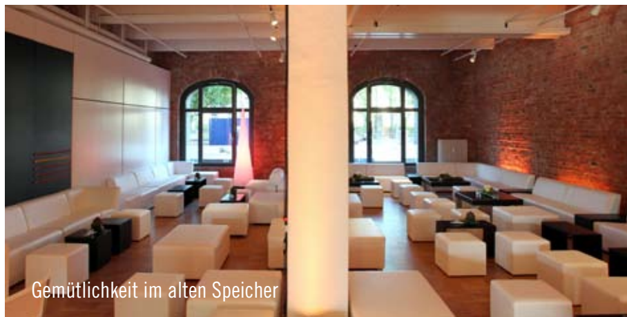
Gemütlichkeit im alten Speicher

Berlin hat 500km Ufer. Davon befinden sich die schönsten 232m am Spreespeicher. Inmitten des neuen Kreativbezirks Berlin-Friedrichshain ist in der City eine Oase in unmittelbarer Wasserlage entstanden.