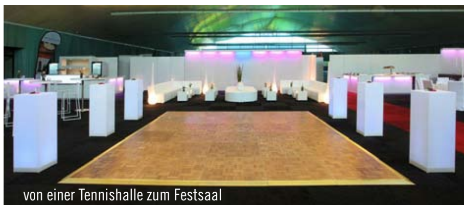
von einer Tennishalle zum Festsaal

In Absprache mit dem Brautpaar entwickelte die Projekt- und Visualisierungsabteilung der Party Rent Group ein komplett individuelles Ausstattungskonzept. Für das Brautpaar wird die Feier in bester Erinnerung bleiben: „Wir haben ein ganz tolles Fest gefeiert und möchten uns herzlich bei Party Rent für den engagierten Einsatz des Auf- und Abbauteams sowie für die Ausstattungsplanung unserer Hochzeitsfeier bedanken.“