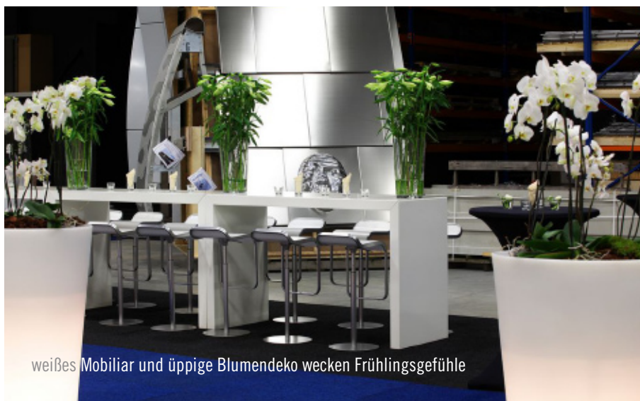
weißes Mobiliar und üppige Blumendeko wecken Frühlingsgefühle

Ganz herzlich möchte sich die Party Rent Group beim Fox Partycentrum für die angenehme Zusammenarbeit bedanken.