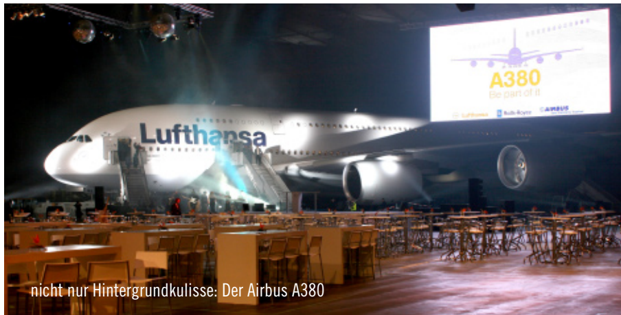
nicht nur Hintergrundkulisse: Der Airbus A380