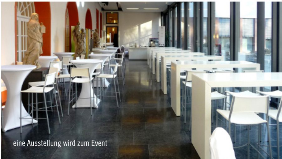
eine Ausstellung wird zum Event

Kulinarische Vielfalt der Mainzer Gastronomen begeisterte die Gäste. Die Speisen wurden in Buffetform auf Party Rent Buffetelementen präsentiert. Hierfür lieferte der Frankfurter Standort Table Top wie Porzellan, Gläser und Besteck. Das schlichte weiße Mobiliar fügte sich in die geradlinige, moderne Architektur ein und verwandelte den Innen- sowie den Außenbereich vom Landesmuseum in ein feierliches Event. Eine Showeinlage der Fire Dancers „Helmnot“ war der krönende Abschluss der erfolgreichen Veranstaltung.