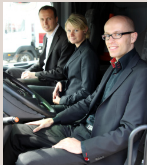
Party Rent Bocholt - ein Trio mit 4 Fäusten