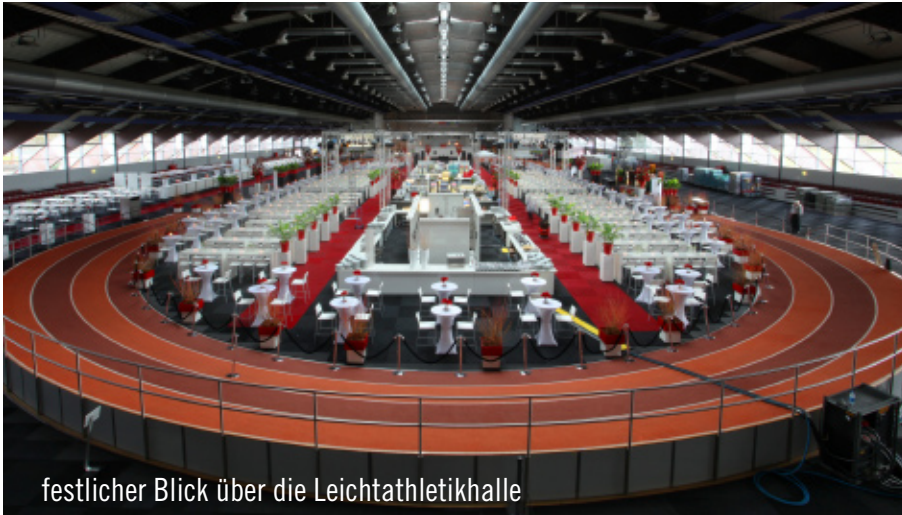
festlicher Blick über die Leichtathletikhalle

Profi-Boxer Wladimir Klitschko hat seinen Weltmeistertitel im Schwergewicht verteidigt. Vor rund 50.000 Zuschauern besiegte der Ukrainer am 20. März 2010 in der Düsseldorfer ESPRITarena den US-Amerikaner „Fast“ Eddie Chambers durch K.o. in der zwölften Runde. Für Klitschko war es der erste Kampf nach seiner erfolgreichen Titelverteidigung gegen Ruslan Chagaev im Juni 2009, als er in der Gelsenkirchener VELTINS-Arena boxte.