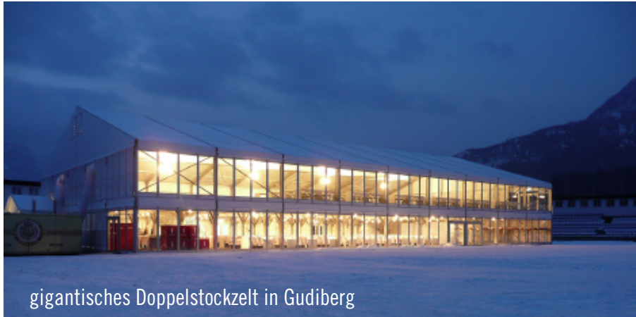
gigantisches Doppelstockzelt in Gudiberg

Vom 10. - 14. März 2010 fand in Garmisch-Partenkirchen der Skiweltcup statt. An den Pisten Kandahar und Gudiberg kämpften die besten Skirennläufer/innen um die Titel in der Abfahrt, im Riesenslalom sowie im Super-G. Beauftragt von der Losberger GmbH war auch die Party Rent Group an beiden Wettkampfstandorten am Start. Im Gegensatz zu den Sportlern traten beide Unternehmen nicht gegeneinander an, sondern starteten als Team. Während Losberger für den Zeltbau an den beiden Wettkampfstandorten verantwortlich war, trug die Party Rent Group die Verantwortung für die Innenausstattung der Zelte mit Mobiliar.