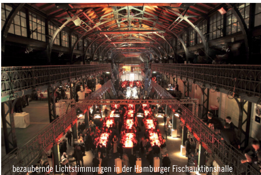
bezaubernde Lichtstimmungen in der Hamburger Fischauktionshalle

Während die Taufparty noch im vollen Gange war und die Geladenen ein prachtvolles Feuerwerk bestaunten, war die AIDAblu schon zu einer 11-tägigen Jungfernfahrt nach Mallorca aufgebrochen. AHOI AIDAblu!