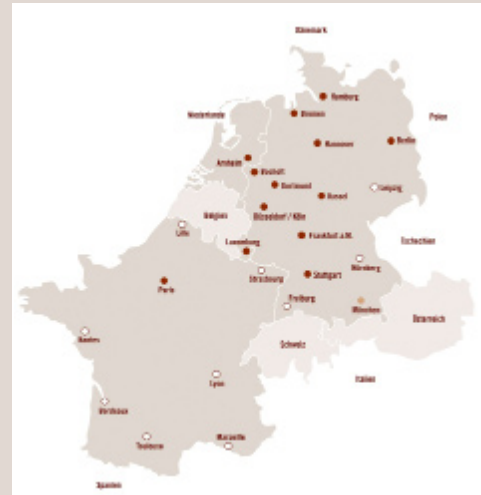
Standortkarte der Party Rent Group

Party Rent® Paris S.à r.l. T: +33 1 60 04 11 73 E: paris@partyrent.com