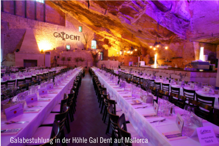
Galabestuhlung in der Höhle Gal Dent auf Mallorca

Anlässlich der Programmvorstellung des neuen Sommerkataloges 2010 von ITS, Jahn Reisen und Tjaereborg beauftragte die REWE Touristik Gruppe erneut die Party Rent