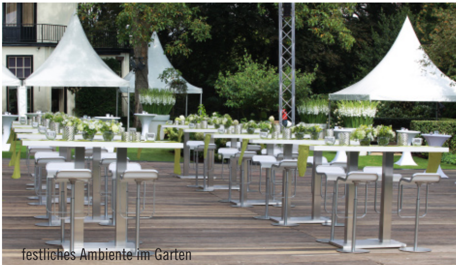
festliches Ambiente im Garten

sich farblich alles in die Natur einfügte, so dass die Farben Weiß und Grün dominierten. Neben weiß-blühenden Pflanzen passten weiße Ibiza-Stehtische mit weißen LEM-Hockern hervorragend ins Gesamtbild. Unter sieben aufgestellten Pagoden konnten sich die Geladenen auf eine Kissenschlacht im weiß-grünen Loungebereich einstellen. „Hooglevan en Proosten“ auf das Jubelpaar!