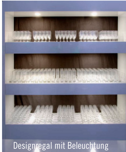
Designregal mit Beleuchtung

Die BGL BNP Paribas nutzte die Räumlichkeiten der Luxemburger Messehallen dazu, ihre jährliche Personalfeier für 2.600 Mitarbeiter auszurichten. Für die Ausstattung beauftragte die Agentur Emotion Event Management Party Rent Luxemburg. Bereits zum 8. Mal zeichnete der Luxemburger Event-Ausstatter verantwortlich für das gesamte Equipment. Neun Auflieger mit Materialien wurden aus Echternach angeliefert. Unterstützung brachte die Hauptzentrale in Bocholt mit weiteren fünf Aufliegern mit Ausstattungsmaterial.